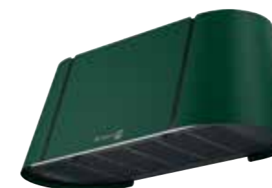
Beat XL Wall