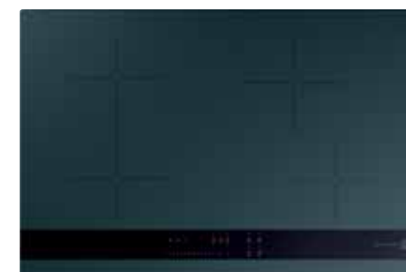
FCH 84 DF KL

Aby uczcić naszą 70-tą rocznicę i ponad 30 milionów okapów dostarczonych do Waszych domów, z dumą prezentujemy ekskluzywną kolekcję serii Beat - w tym okapy podwieszane i przyścienne - również w wersji XL, a także dwie płyty indukcyjne, wszystkie w eleganckim wykończeniu Dark Forest .