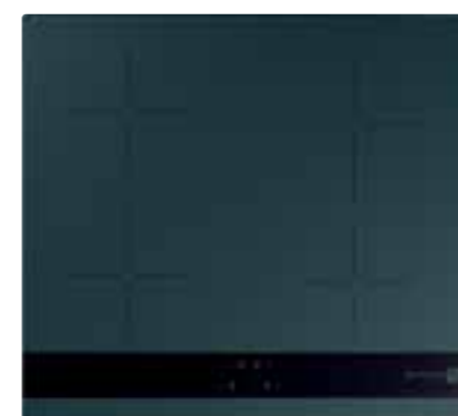
FBH 64 DF

WYJĄTKOWE WYDARZENIE JAKIM JEST 70-LECIE FIRMY ZASŁUGUJE NA SPECJALNĄ, ROCZNICOWĄ EDYCJĘ: OKAPY BEAT I PŁYTY INDUKCYJNE W KOLORZE DARK FOREST.