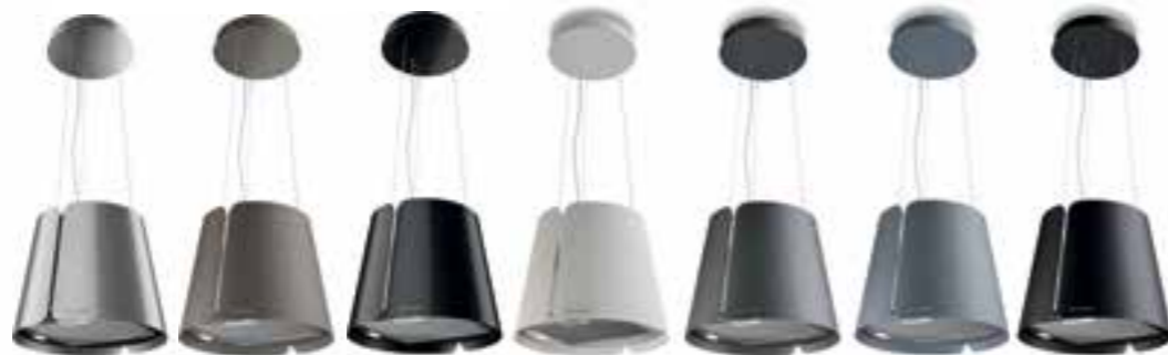
X/BK MATT TITANIUM MATT BK GLOSS WH MATT DG MATT DB MATT BK MATT